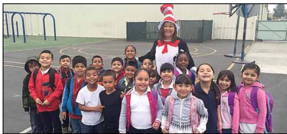
The Cat in the Hat welcoming students to school