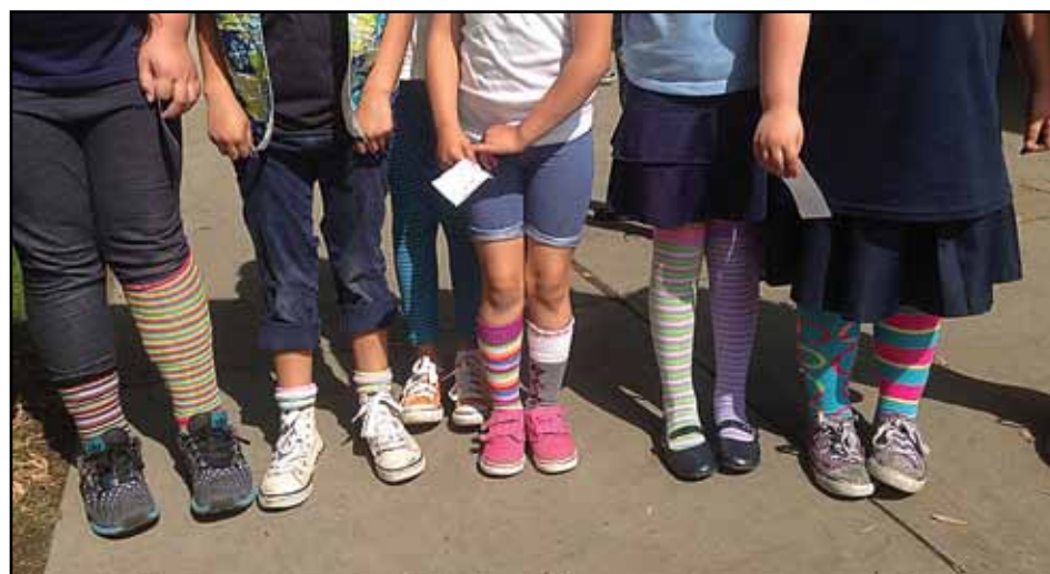
First graders showing off their crazy and mismatched socks